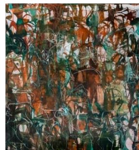
Rubicon Painting No. 07