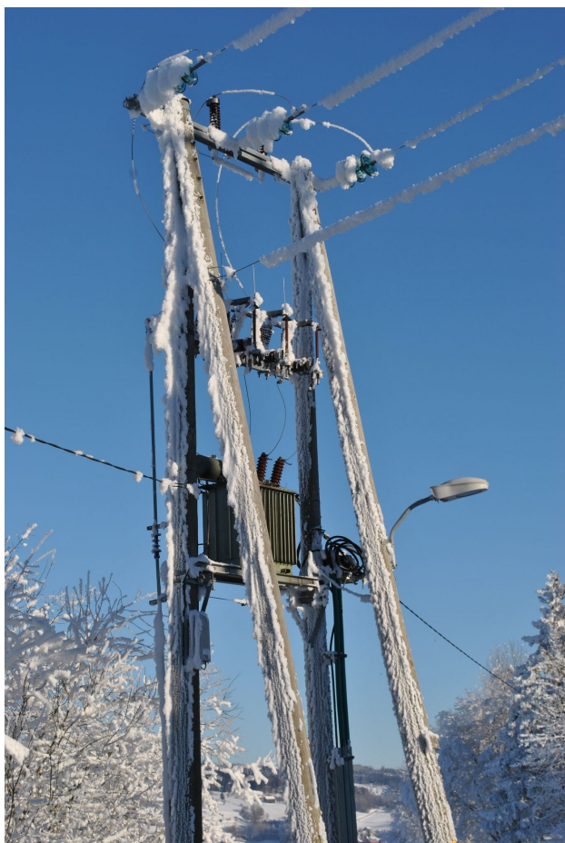
Bilde av en isete høyspentmast, Mylla 2019