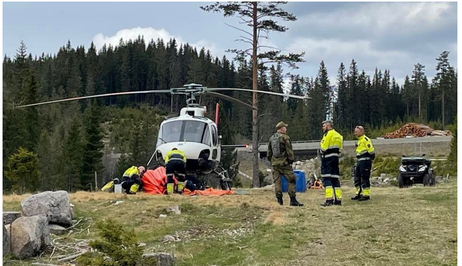
Bilde fra skogbrannøvelse på Brovoll 2022

I Helhetlig risiko- og sårbarhetsanalyse for Lunner kommune er skog- og utmarksbrann, langvarig strømbortfall og ekstremvær vurdert å ha høyest sannsynlighet. Jernbaneulykke med farlig gods, jordskred, svikt i vannforsyning, stort luftbåret utslipp fra utlandet, langvarig bortfall av strøm og ekstremvær er vurdert å gi størst konsekvenser. Samlet sett er det langvarig bortfall av strøm og ekstremvær som er vurdert å kunne ha høyest risiko. Analysene er gjort ut fra scenarier. Forslag til tiltak ut fra funn i analysene, er innarbeidet i tiltakene i denne planen.